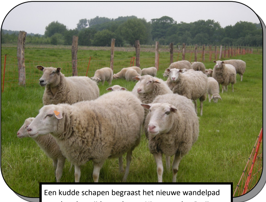
Een kudde schapen begraast het nieuwe wandelpad aan de achterzijde van hoeve Nieuwgoed te Parijs.

Ooit gehoord van 'Een nieuwe lente, een nieuw bos' ? Het was onze eerste actie op 21 maart 2004. Wij lieten toen van ons horen. Vele verenigingen, scholen, wijkcomités van Deinze bundelden hun krachten. De gronden aan de Krekelstraat te Astene waren net verworven door het Vlaamse Gewest doch mochten niet worden bebost. En dat was geen goed nieuws voor het bosarme Deinze. Wij voerden dan ook actie voor ons