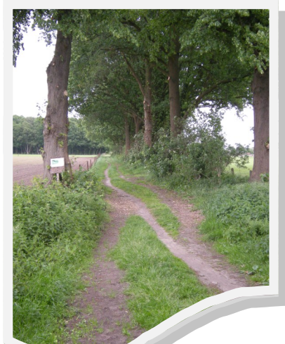
Het boswachtersdreefje wordt een echte dreef met meer bomen

Geef de positieve evolutie van dit plan voor jullie zelf voldoening ? Er gaan wel vele jaren over. Het gaat traag.