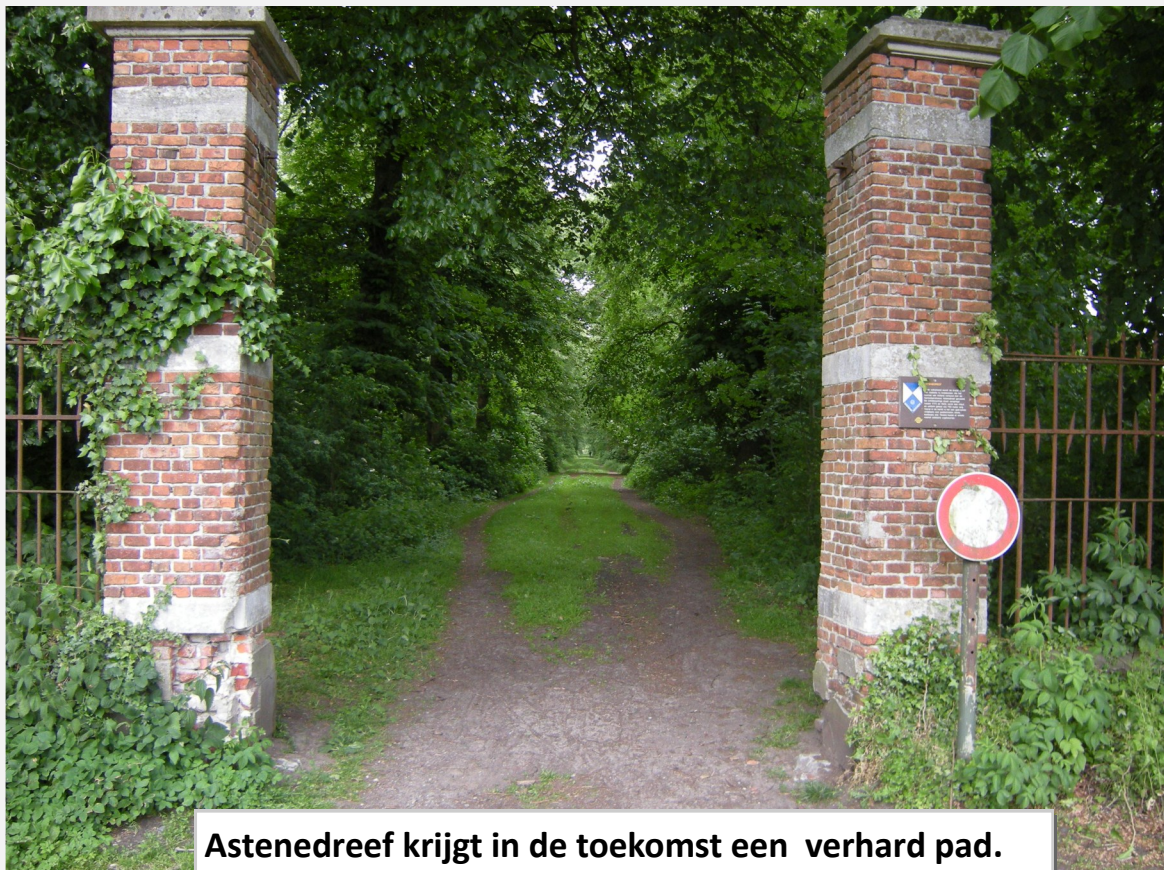
Astenedreef krijgt in de toekomst een verhard pad.

(foto: Tony De Neve samen met Vlaams minister Joke Schauvliege bij het persmoment op 3 maart 2011.)